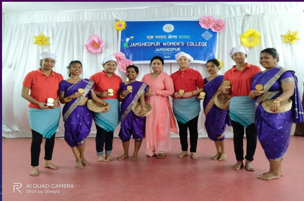
Goa Cultural Dance