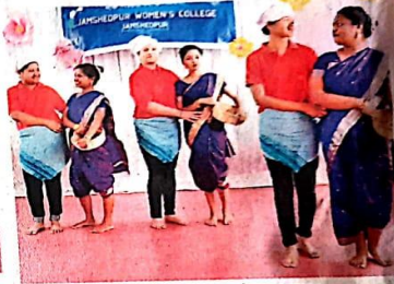
विशुपुर स्थित विमेंस कॉलेज में शुक्रवार को आयोजित क्राफ्ट मेकिंग प्रतियोगिता में शामिल छात्राएं • जागरण